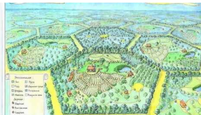
Natura podpowiada jak krąży energia zasilająca komórki

Nie sposób kupić ziemię i się wybudować. Sposobem jest osiedlić się tam, gdzie uwarunkowania nie przerwą ciągłości rodu. Gdzie sąsiedzi, a później dzieci sąsiadów będą podnosić wibrację tego miejsca. Dlatego spotykamy się mając nadzieję na znalezienie jedynomyślników, z którymi możemy działać wspólnie.